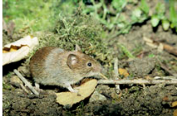
Campagnol roussâtre - Myotes glareolus

Le Campagnol terrestre ou Rat taupier ( Arvicola terrestris = amphibius ) occupe un large territoire depuis l'Europe de l'ouest (France et Grande-Bretagne), jusqu'en Sibérie (Russie). Il peut vivre jusqu'au cercle arctique au nord et descendre jusqu'au sud de l'Iran, au Proche-Orient. Ce campagnol de grande taille apprécie les habitats en zones humides marécageuses ou proches des cours d'eau de plaine ou de montagne. C'est un bon nageur, principalement végétarien.