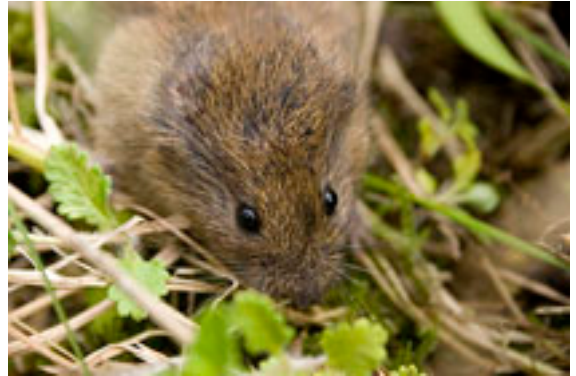
Campagnol agreste – Microtus agrestis

Le Campagnol des hauteurs ( Microtus gregalis )