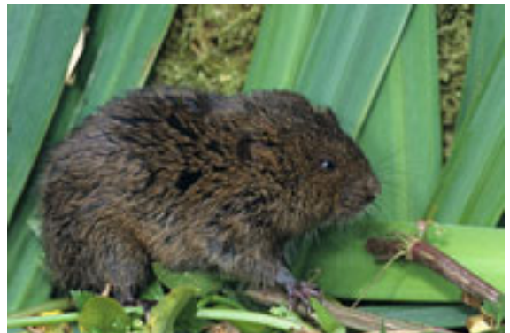
Campagnol terrestre – Arvicola terrestris

Le Lemming à collier ou lemming arctique ( Dicrostonyx torquatus ) est un rongeur que l'on rencontre dans la toundra du cercle arctique de Russie. Les lemmings à collier vivent en colonies et sont connus pour leurs migrations lorsque la taille de la population devient trop importante et que la nourriture (végétaux) se raréfie.