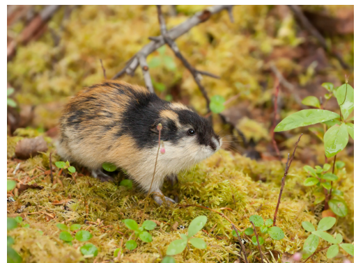
Lemming de Norvège – Lemmus lemmus