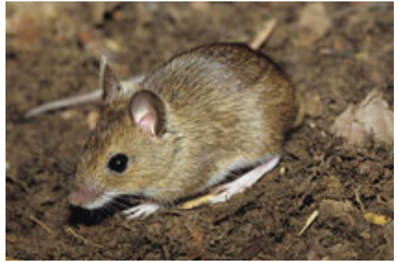
Mulot – Apodemus sylvaticus

La Souris grise ( Mus musculus ) est une espèce d'origine eurasienne mais qui occupe actuellement une aire de répartition mondiale. Il s'agit d'une espèce typiquement commensale de l'Homme qui vit dans les habitats construits ou à proximité. Elle semble fuir les forêts et les zones désertiques.