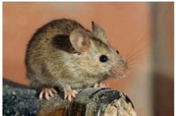
Souris grise – Mus musculus