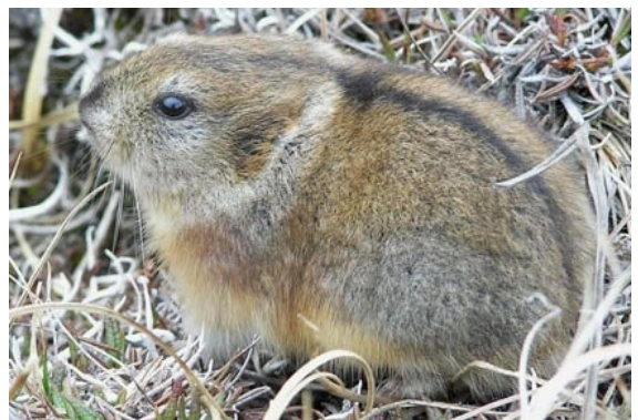
Lemming à collier – Dicrostonyx torquatus

Le Lemming de Norvège ( Lemmus lemmus ) est un rongeur apparenté aux campagnols et aux hamsters. Ce lemming est caractéristique des hautes latitudes arctiques. La toundra est son habitat principal et ces animaux végétariens sont connus pour l'importance de leurs migrations.