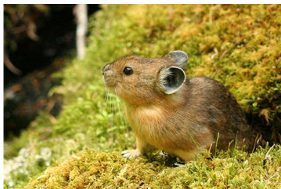
Pika des steppes – Ochotona pusilla