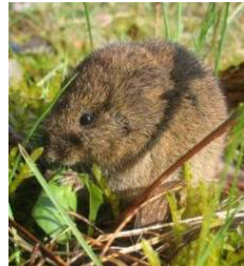
Campagnol des hauteurs – Microtus gregalis

Le Campagnol des champs ( Microtus arvalis ) préfère les paysages ouverts avec un sol profond et couverts d'une végétation peu élevée sans arbres, parsemés éventuellement de quelques buissons. Il affectionne particulièrement les prairies. Les labours lui sont défavorables.