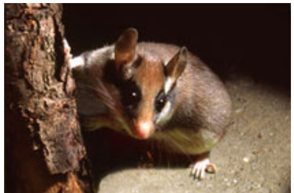
Lérot – Eliomys quercinus

Le Muscardin ( Muscardinus avellanarius ) est une espèce largement répandue en Europe jusqu'en Turquie. Il est toutefois absent de la péninsule ibérique et du sud-ouest de la France. C'est une espèce arboricole forestière qui affectionne les bois de feuillus, en particulier les lisières ou les taillis. Il se nourrit d'insectes, de fleurs et de fruits.