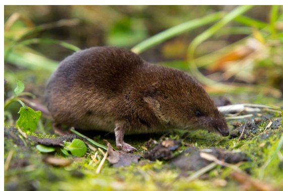
Musaraigne carrelet – Sorex araneus

La Musaraigne leucode ( Crocidura leucodon ) se rencontre du nord-ouest de l'Europe jusqu'à la Mer Caspienne en Asie. Elle peuple tous les milieux : prairies, champs cultivés, zones urbaines, jardins, zones humides, pierriers et mêmes les steppes semi-désertiques de Russie. Elle se nourrit d'invertébrés (insectes, larves, vers).