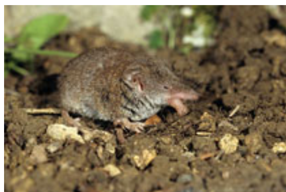
Musaraigne musette - Crocidura russula

Climat : tempéré océanique à méditerranéen