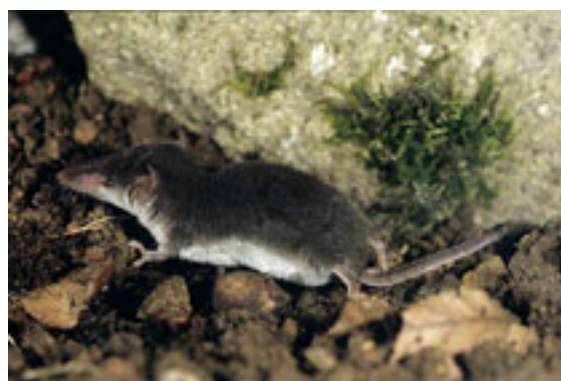
Musaraigne leucode - Crocidura leucodon

La Musaraigne musette ( Crocidura russula ) est un insectivore qui occupe une aire de répartition couvrant le nord-ouest de l'Afrique ainsi que le sud et l'ouest de l'Europe. Elle vit dans des habitats variés : maquis, zones humides, prairies, lisières de forêt, champs cultivés, milieux montagneux, zones urbaines, jardins, fermes, avec une prédilection pour les vieux murs en pierres sèches.