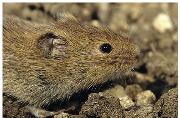
Campagnol des champs – Microtus arvalis